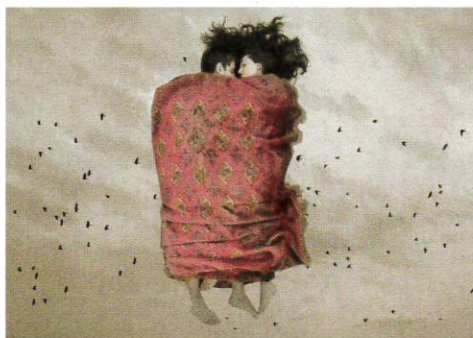
BABAK KAZEMI, LA FUITE DE SHIRIN ET FARHAD.

Abbaye de Daoulas 21, rue de l'Église, à Daoulas (29) www.cdp29.fr